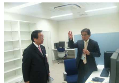
和名ヶ谷に開設される新東京病院の内覧会。地域医療の重要性を再確認しました。